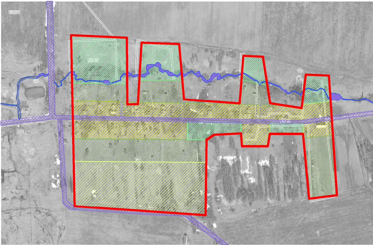
Границы населенного пункта