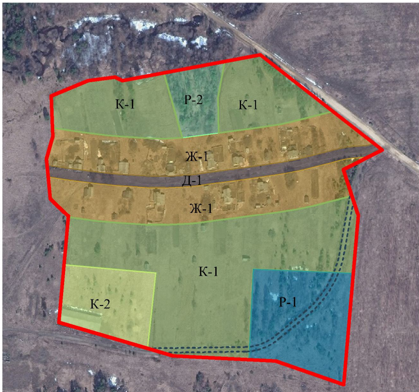
Зоны с особыми условиями использования территории

Правила землепользования и застройки Симаковского сельского поселения Верхнеландеховского муниципального района Ивановской области. Схема функционального зонирования (совмещенная с схемой зон с особыми условиями использования территории) д.Крутовская